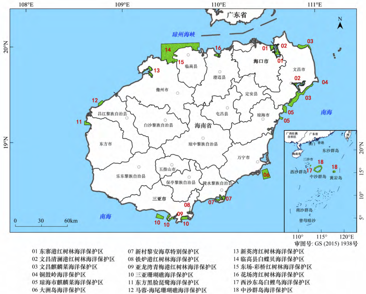
图 1 海南省已建海洋保护区空间分布 Fig. 1 Spatial patterns of marine protected areas in the Hainan province

km 2 ,管辖海域包括海南岛周边海域和西沙群岛、中沙群岛、南沙群岛的岛礁及其海域,总面积约 200 万 km 2 。海南省地跨亚热带与热带两个气候带,形成了丰富多样的海洋生态系统,包括:河口、海岛、潟湖、上升流、红树林、珊瑚礁、海草床等 [13-14] 。在海洋保护区建设方面海南省基础较好,海洋保护区数量和面积逐步增加,截至 2012 年已建各级海洋保护区 18 处,其中海洋自然保护区 17 处,海洋特别保护区 1 处,总面积约 2.44 万 km 2 (图 1)。此外还建有国家级水产种质资源保护区 2 个,覆盖面积约 340 km 2 。